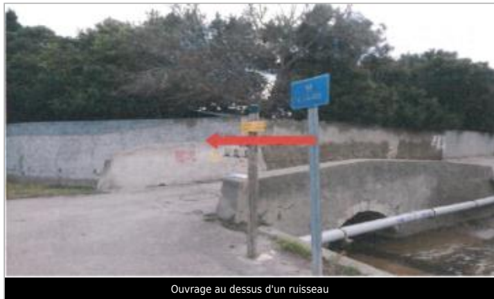
Ouvrage au dessus d'un ruisseau

GÉOLOCALISATION Coordonnées WGS84 : X: 2.97801890 / Y: 43.03117200 Coordonnées RGF93 (Lambert 93) X: 698207 / Y: 6214649.99 Coordonnées RGF93 (ETRS89) : X: 2.9780189 / Y: 43.031172 Code Hydro: Y08-0400 Rive de référence: