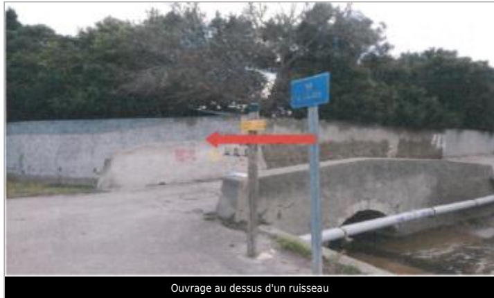
Ouvrage au dessus d'un ruisseau

GÉOLOCALISATION Coordonnées WGS84 : X: 2.97801890 / Y: 43.03117200 Coordonnées RGF93 (Lambert 93) : X: 698207 / Y: 6214649.99 Coordonnées RGF93 (ETRS89) : X: 2.9780189 / Y: 43.031172 Code Hydro: Y08-0400 Rive de référence: