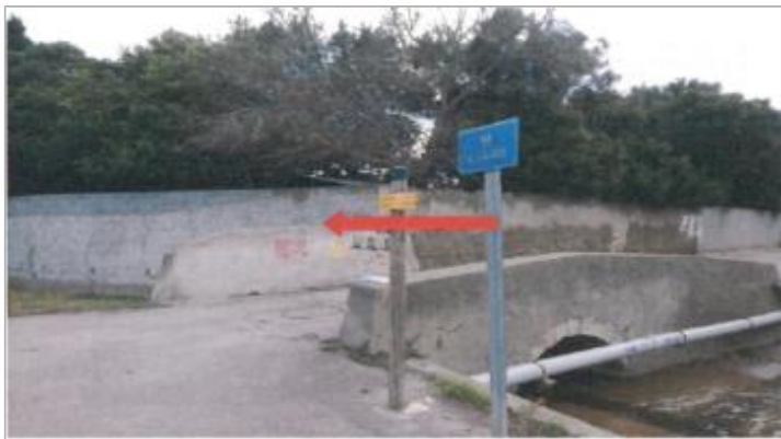
Ouvrage au dessus du ruisseau

MARQUE Visibilité : Oui État du repère : Bon