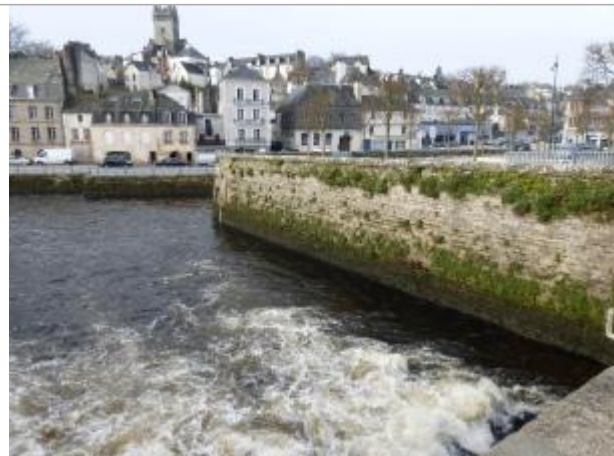
vue générale de la confluence de l'Isolé et de l'Ellé formant la Laïta - sous influence maritime