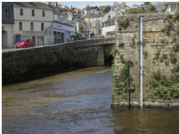
Echelle limnimétrique de la station de Charles de Gaulle à Quimperlé

Altitude calculée de l'eau (en m) : 5.059 m