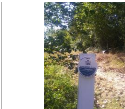
Repère du niveau atteint par la crue du 26 octobre 1979