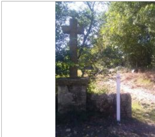
SEV-4 : l'Aveyron au lieu-dit Restous