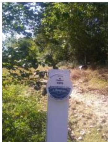
Repère du niveau atteint par la crue du 26 octobre 1979