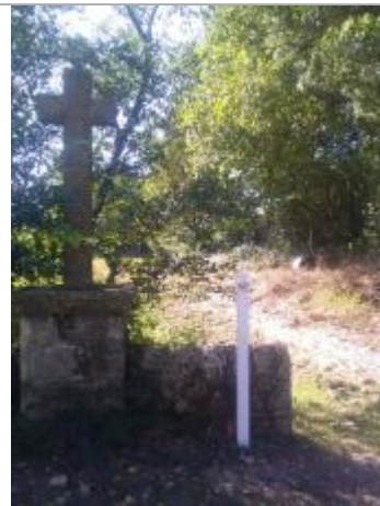
SEV-4 : l'Aveyron au lieu-dit Restous

Coordonnées RGF93 (ETRS89) : X: 2.9754107 / Y: 44.3538439