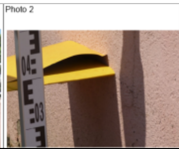
Trace du maximum de la crue sur le muret de clôture du parking du super marché du 23 rue de Metz