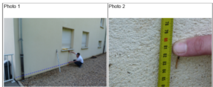
Trace du maximum de la crue sur la façade coté Ouest au 1 rue de l'Europe

SOURCE DE REPÉRAGE : DDT 54 (JUN 2016) - 15/06/2016