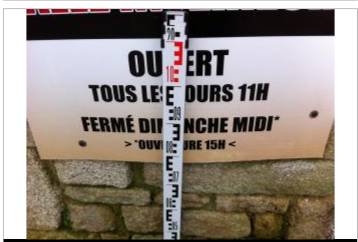
Sol au droit du mur du bar au niveau d'un panneau publicitaire présent lors de l'inondation et du repérage

GÉNÉRAL Code : DHE_29233-020-020 Date de mise à jour : 01/03/2022 Auteur : SPC VCB