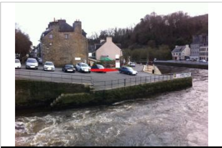
vue générale du quai surcouf, parking et bar

GÉOLOCALISATION Coordonnées WGS84 : X: -3.54495690 / Y: 47.87066800 Coordonnées RGF93 (Lambert 93) X: 211248.72 / Y: 6772519.77 Coordonnées RGF93 (ETRS89) : X: -3.5449569 / Y: 47.870668 Code Hydro: _ELAITA_ Rive de référence: Gauche