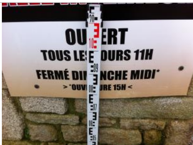
Sol au droit du mur du bar au niveau d'un panneau publicitaire présent lors de l'inondation et du repérage

Altitude calculée de l'eau (en m) : 4.49