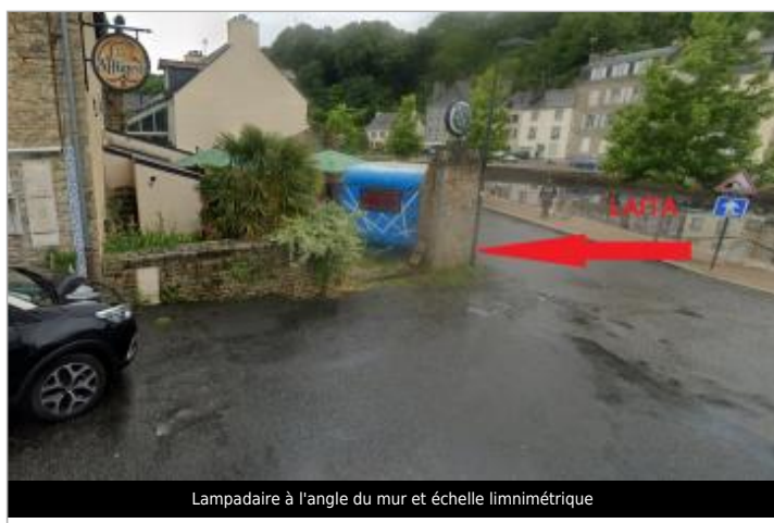
Lampadaire à l'angle du mur et échelle limnimétrique