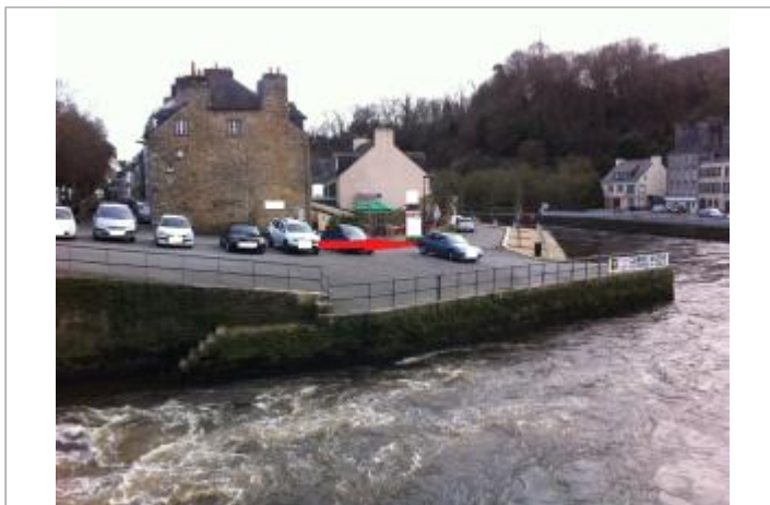
vue générale du quai surcouf, parking et bar