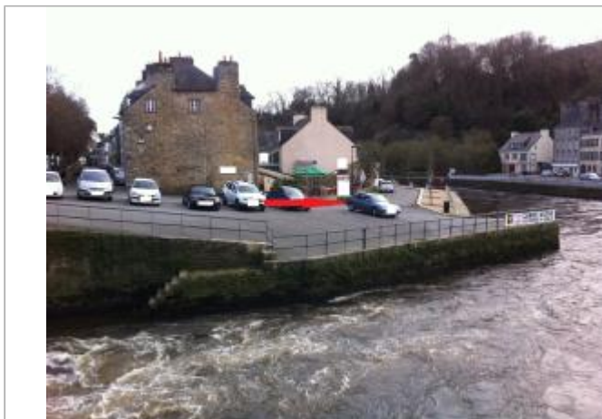
vue générale du quai surcouf, parking et bar