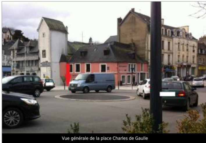
Vue générale de la place Charles de Gaulle