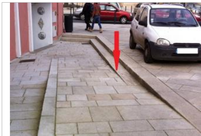
Sol de la placette (2ème série de pavés sur le seconde niveau).

Système altimétrique : NGF IGN 1969 (système normal)