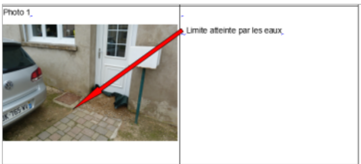
Limite de l'inondation

GÉNÉRAL Code : WEB_R_201810042856 Date de mise à jour : 06/09/2019 Auteur : DDT54_PR-GC_MH