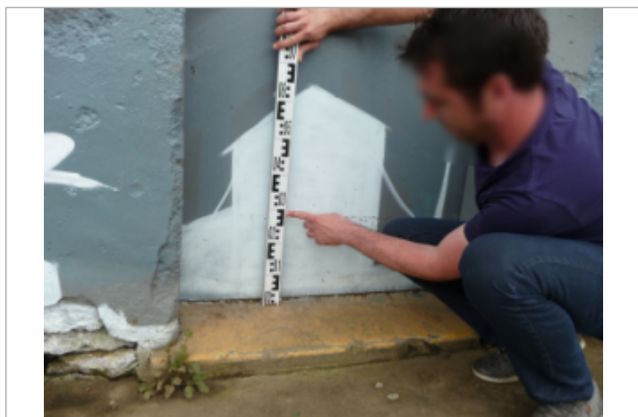
Trace sur la porte

Altitude calculée de l'eau (en m) : 182.09 m