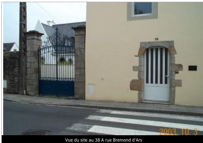
Vue du site au 38 A rue Bremond d'Ars