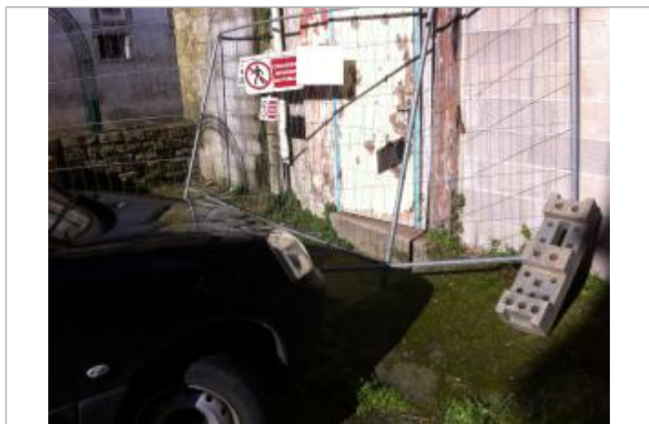
seuil de la porte (murée lors du repérage)

Description référence du repère : seuil de la porte (murée lors du repérage) Différence entre le niveau d'eau et la référence (en m) : -0.030 m