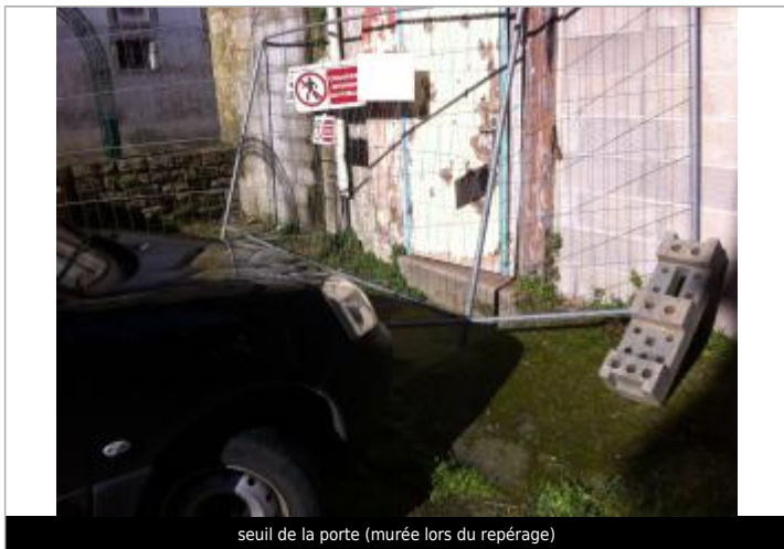
seuil de la porte (murée lors du repérage)

Différence entre le niveau d'eau et la référence (en m) : -0.030 m