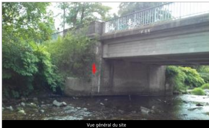
Vue général du site