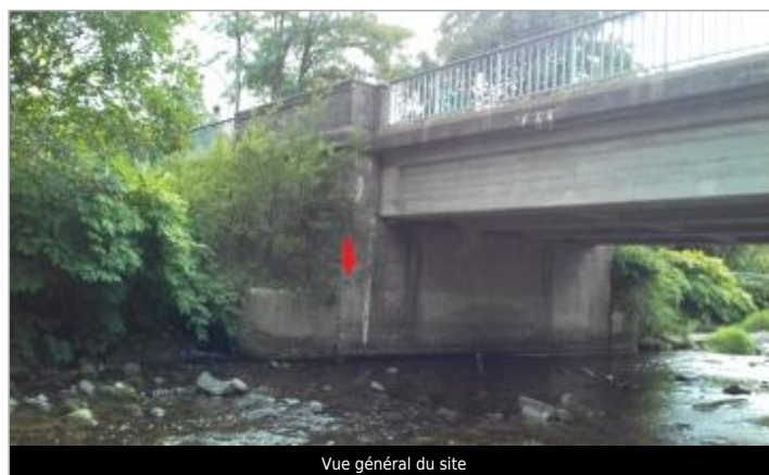
Vue général du site