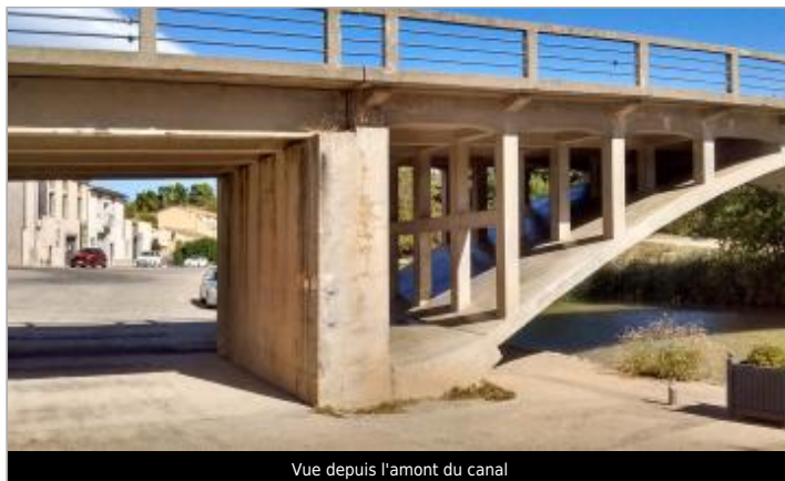
Vue depuis l'amont du canal