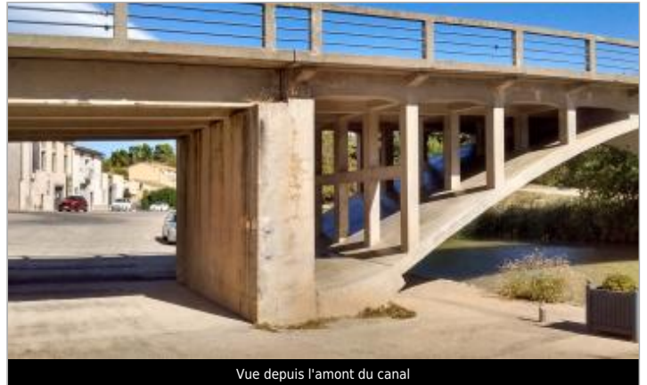
Vue depuis l'amont du canal