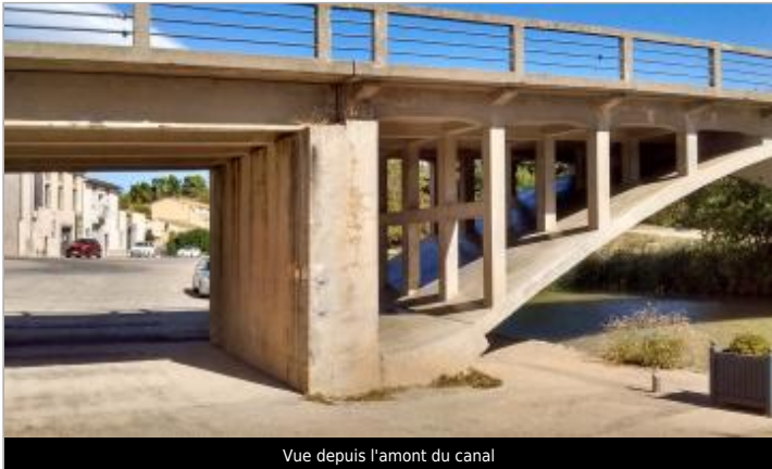
Vue depuis l'amont du canal

GÉOLOCALISATION Coordonnées WGS84 : X: 2.65925780 / Y: 43.24768400 Coordonnées RGF93 (Lambert 93) X: 672309.65 / Y: 6238781.07 Coordonnées RGF93 (ETRS89) : X: 2.6592578 / Y: 43.247684 Code Hydro: Y1430520 Rive de référence: Droite