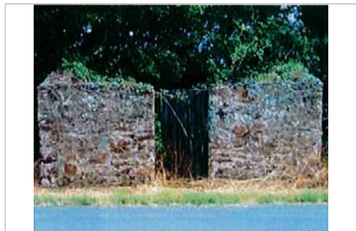
Auteur - CORELA