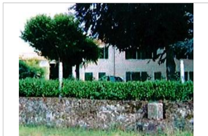
Auteur - CORELA