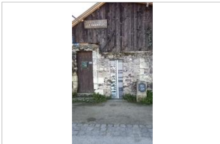
Vue sur site