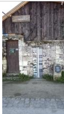
Vue sur site