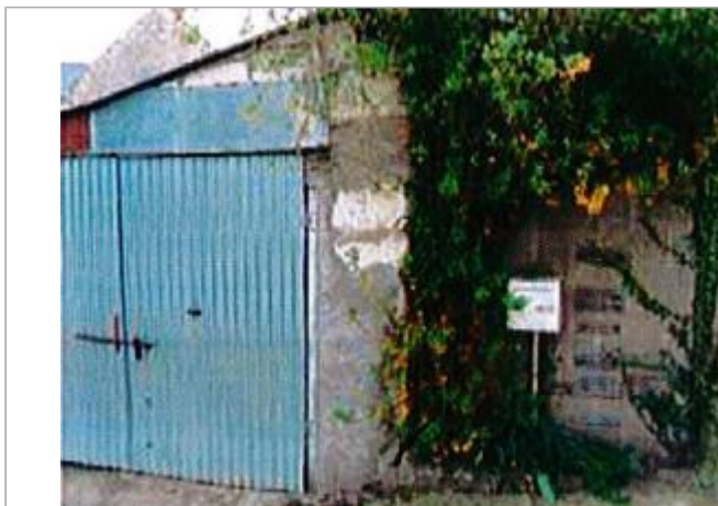
Le Hardas_Rochefort Sur Loire

Coordonnées WGS84 : X: -0.70270260 / Y: 47.35652260