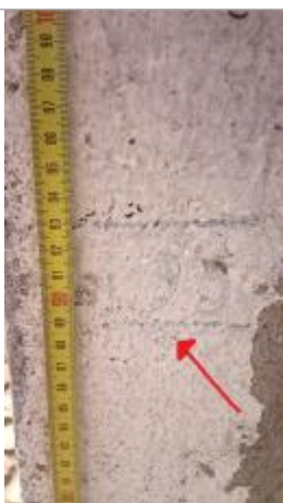
2025_Marque inconnue basse

Altitude calculée de l'eau (en m) : 18.567 m