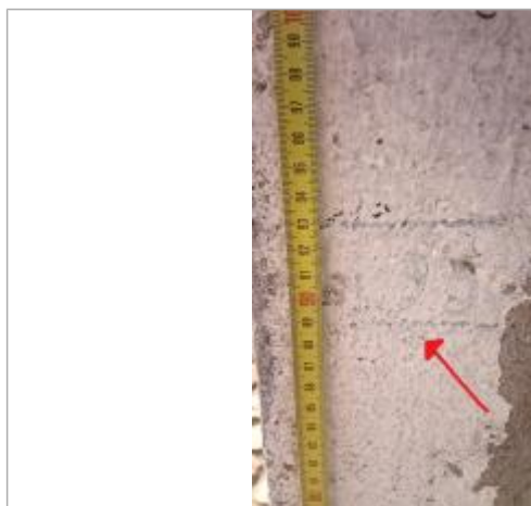
2025_Marque inconnue basse