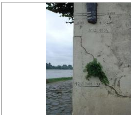
2000_Vue du repère 2001

Altitude calculée de l'eau (en m) : 18.36 m