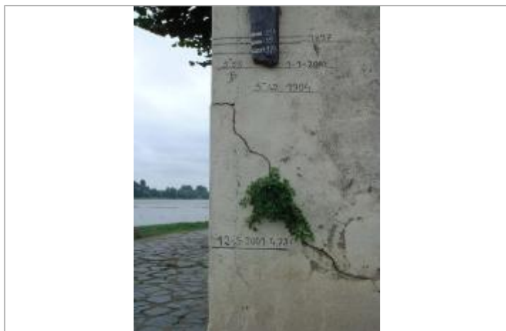
2000_Vue du repère 2001