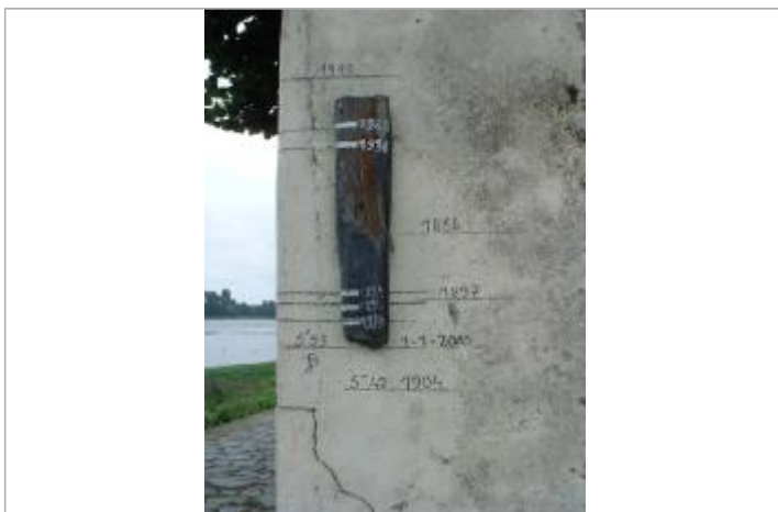
2000_Vue du repère 1994