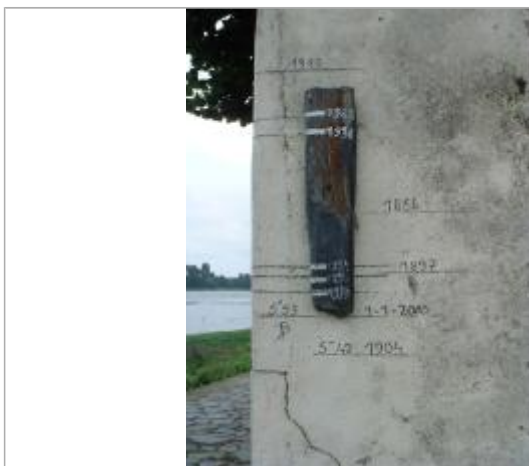
2000_Vue du repère 1936

Altitude calculée de l'eau (en m) : 19.763 m