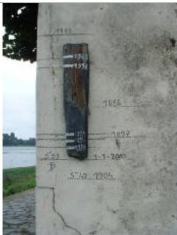
2000_Vue du repère 1897

Altitude calculée de l'eau (en m) : 19.33 m