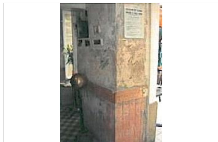
Auteur - CORELA