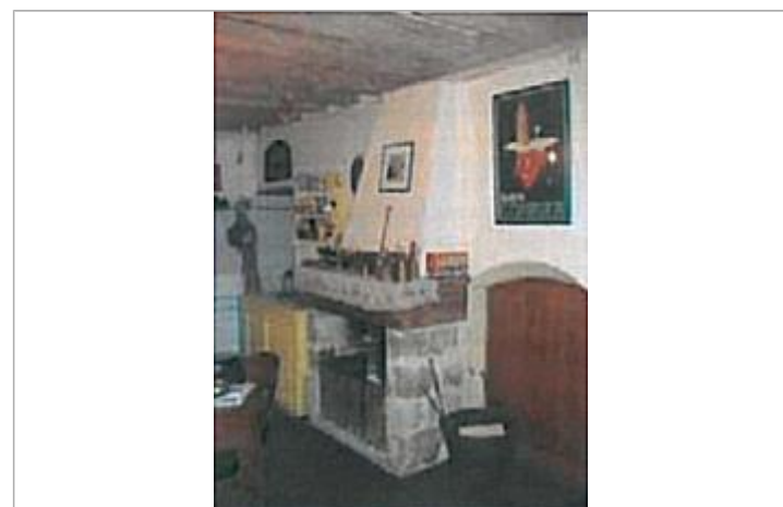
Auteur - CORELA