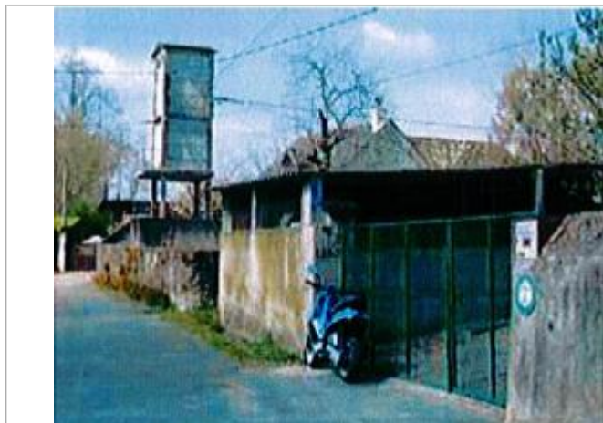
Auteur - CORELA