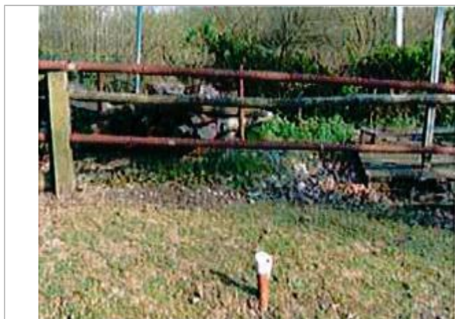
Auteur - CORELA