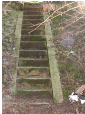
Vue du site BDHE 270 point de repère 377