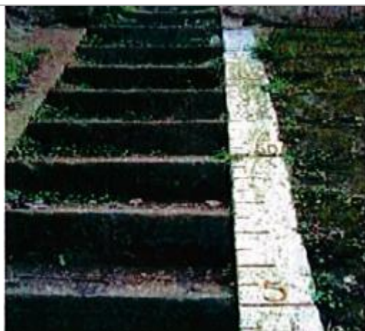
Auteur - CORELA