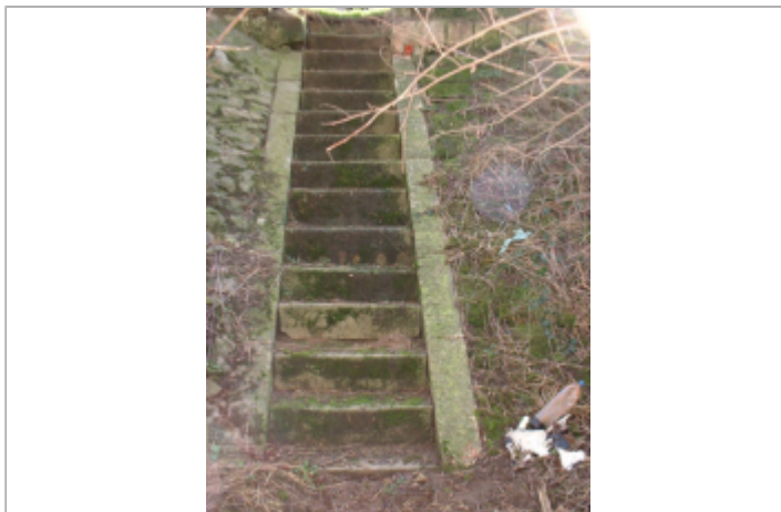
Vue du site BDHE 270 point de repère 377