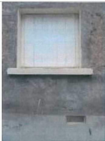
Auteur - CORELA