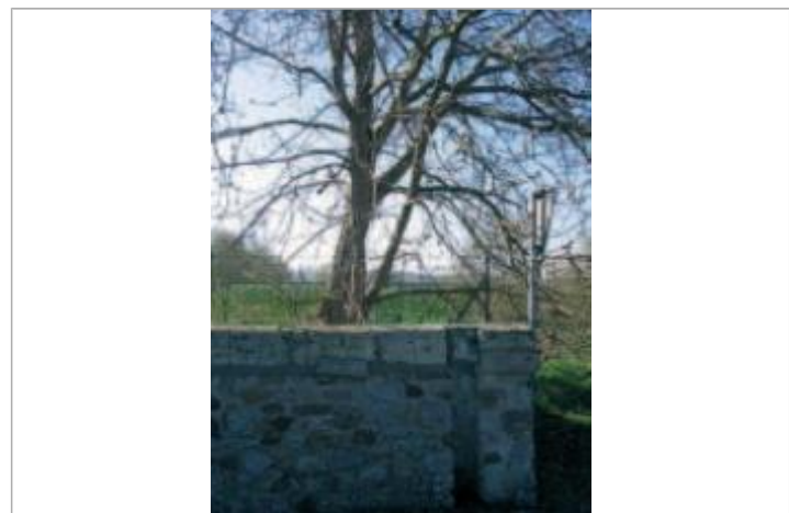
Auteur - CORELA