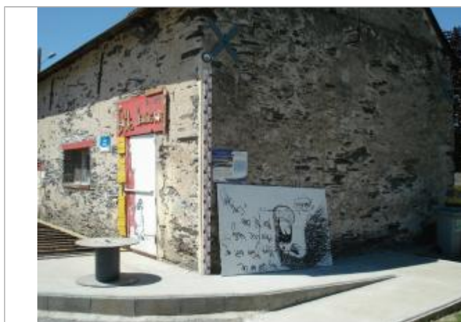
Auteur : EPL - DDT49