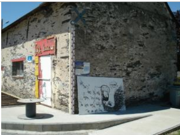
Auteur : EPL - DDT49

Altitude calculée de l'eau (en m) : 22.81 m