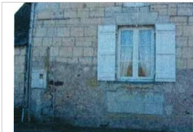
Auteur - CORELA