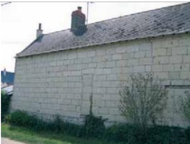
Auteur - CORELA

Altitude calculée de l'eau (en m) : 27.85 m