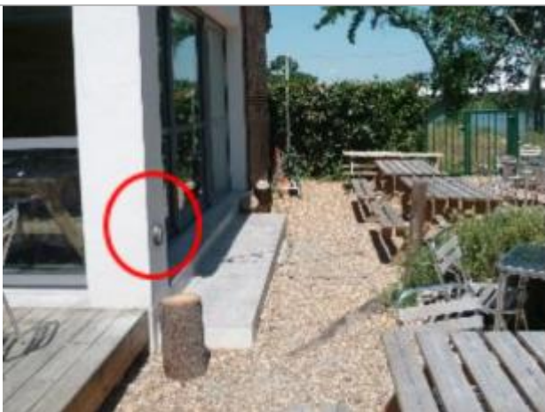
Auteur - DDT49

Altitude calculée de l'eau (en m) : 20.7 m