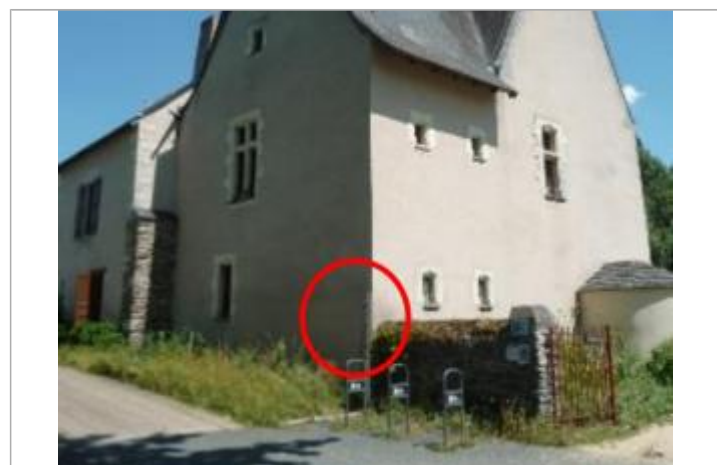
Auteur - DDT49

GÉNÉRAL Code : SPCMLA_R_94_1 Date de mise à jour : 20/10/2018 Auteur : SPC MLA