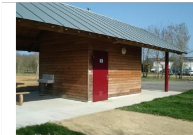
Auteur - DDT49

Altitude calculée de l'eau (en m) : 21.159 m