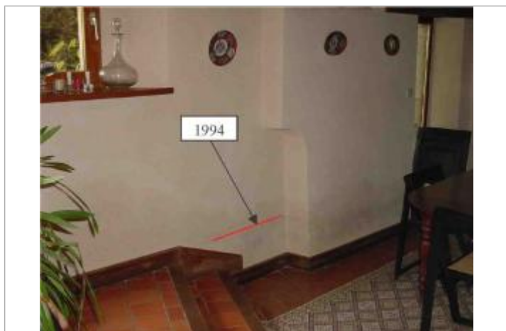
Atlas des Zones Inondables de l'Hyrôme - Laboratoire Régional des Ponts et Chaussées d'Angers - DDT49

Code : SPCMLA_R_32_1 Date de mise à jour : 02/11/2018 Auteur : SPC MLA