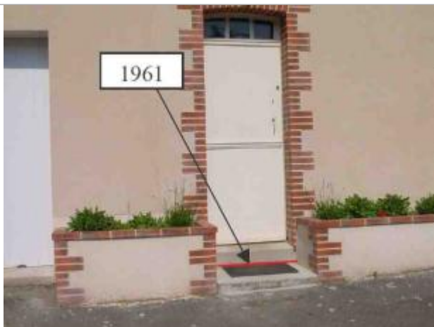
Atlas des Zones Inondables de l'Hyrome - Laboratoire Régional des Ponts et Chaussées d'Angers - DDT49

Altitude calculée de l'eau (en m) : 32.9 m