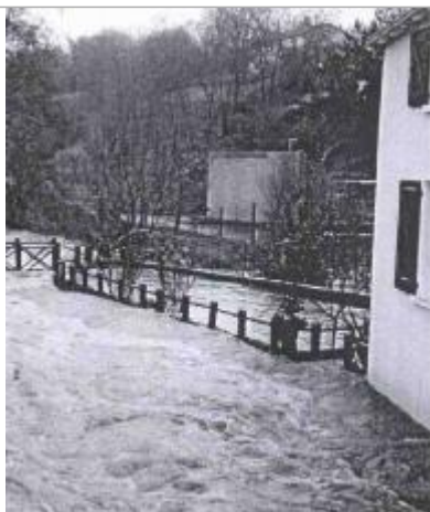
Atlas des Zones Inondables du Lys - Laboratoire Régional des Ponts et Chaussées d'Angers - DDT49