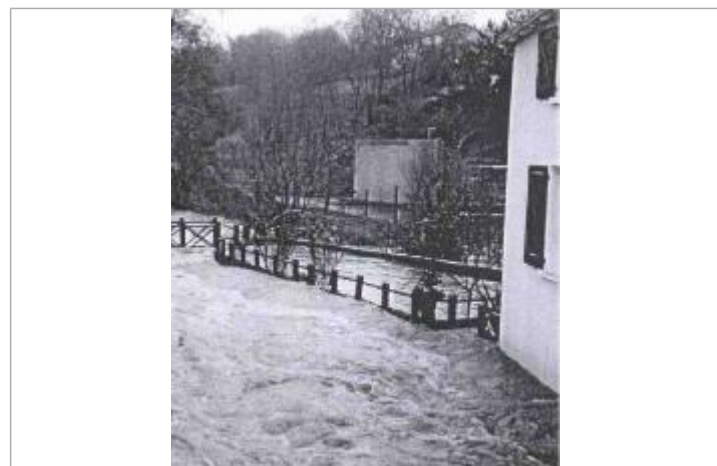
Atlas des Zones Inondables du Lys - Laboratoire Régional des Ponts et Chaussées d'Angers - DDT49