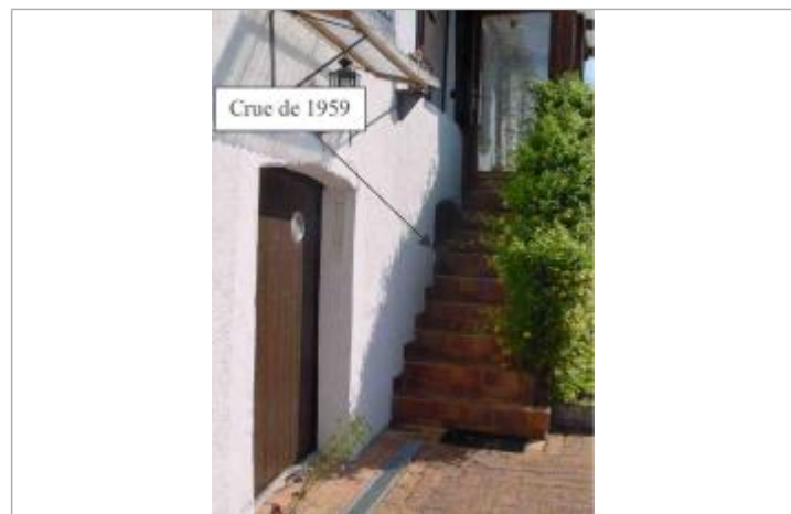
Atlas des Zones Inondables du Lys - Laboratoire Régional des Ponts et Chaussées d'Angers - DDT49

GÉNÉRAL Code : SPCMLA_R_29_1 Date de mise à jour : 02/10/2018 Auteur : SPC MLA