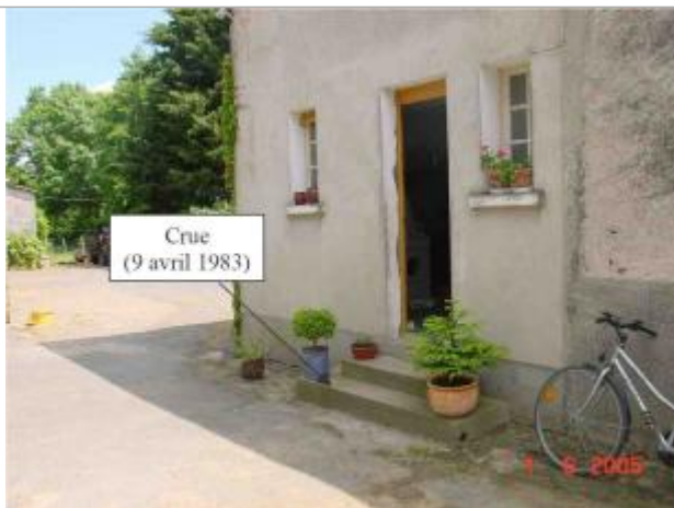
Atlas des Zones Inondables du Lys - Laboratoire Régional des Ponts et Chaussées d'Angers - DDT49

Altitude calculée de l'eau (en m) : 106.13 m