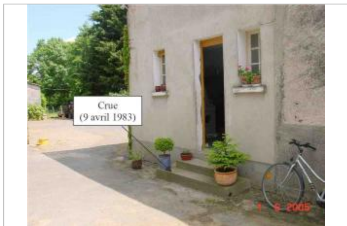
Atlas des Zones Inondables du Lys - Laboratoire Régional des Ponts et Chaussées d'Angers - DDT49

Code : SPCMLA_R_28_1 Date de mise à jour : 02/10/2018 Auteur : SPC MLA