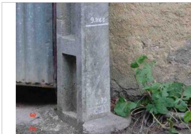
Atlas des Zones Inondables du Layon - Laboratoire Régional des Ponts et Chaussées d'Angers - DDT49

Code : SPCMLA_R_14_1 Date de mise à jour : 06/04/2020 Auteur : SPC MLA