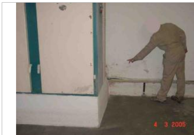
Atlas des Zones Inondables de l'Evre - Laboratoire Régional des Ponts et Chaussées d'Angers - DDT49