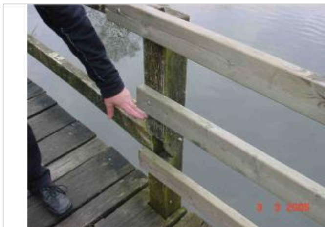
Atlas des Zones Inondables de l'Evre - Laboratoire Régional des Ponts et Chaussées d'Angers - DDT49