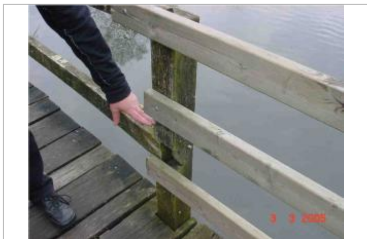
Atlas des Zones Inondables de l'Evre - Laboratoire Régional des Ponts et Chaussées d'Angers - DDT49

Code : SPCMLA_R_6_1 Date de mise à jour : 05/10/2018 Auteur : SPC MLA