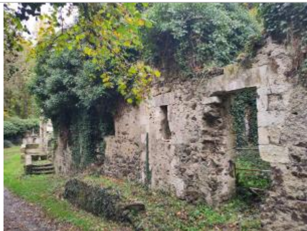
2025_vue du site

Coordonnées WGS84 : X: -1.03798990 / Y: 47.31930060