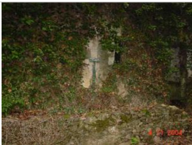
Atlas des Zones Inondables de l'Evre - Laboratoire Régional des Ponts et Chaussées d'Angers - DDT49

Altitude calculée de l'eau (en m) : 15.85 m