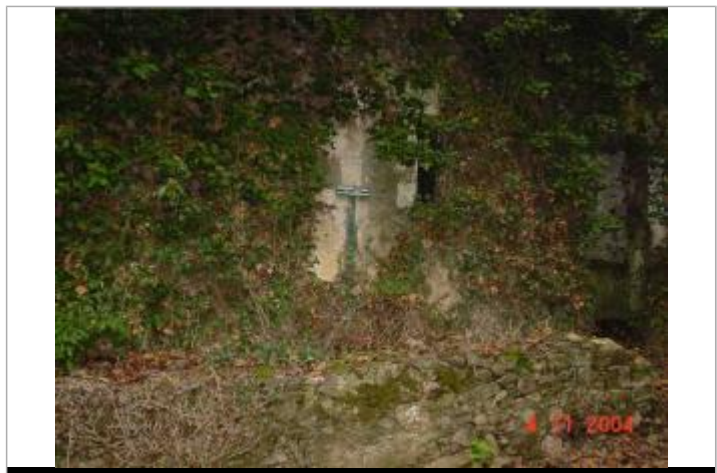
Atlas des Zones Inondables de l'Evre - Laboratoire Régional des Ponts et Chaussées d'Angers - DDT49

GÉNÉRAL Code : SPCMLA_R_3_1 Date de mise à jour : 31/10/2025 Auteur : SPC MLA