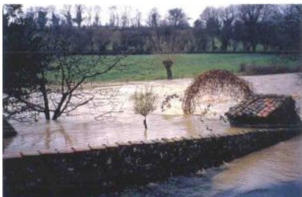
Atlas des Zones Inondables de l'Evre - Laboratoire Régional des Ponts et Chaussées d'Angers - DDT49