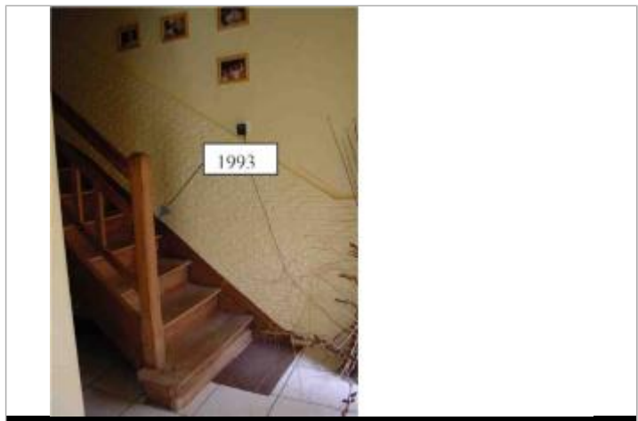
Atlas des Zones Inondables de l'Evre - Laboratoire Régional des Ponts et Chaussées d'Angers - DDT49

GÉNÉRAL Code : SPCMLA_R_1_1 Date de mise à jour : 01/11/2018 Auteur : SPC MLA