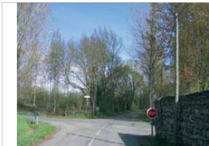
Auteur - CORELA